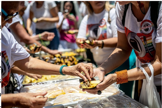
Abbildung 2: Banquetaço CONSEA

Brasilien hat solche Prozesse schon lange hinter sich. Der nationale Ernährungsrat wurde schon im Jahr 1993 gegründet, aber kurz danach wieder aufgelöst und erst 10 Jahre später wiederbelebt. Unter der Regierung Lula da Silvas konnte ab 2003 durch die CONSEA die ‚Zero-Fome‘ (Null-Hunger) Strategie des Landes weitestgehend umgesetzt werden. So erscheint das Land seit 2014 nicht mehr auf der ‚FAO Hunger Map‘ und die Umsetzung diverser