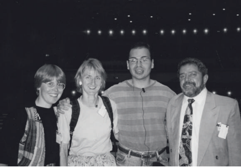
SPD Veranstaltung mit Lula 1994

Nun begab es sich aber auch zu der Zeit, dass Deutschland ein bürokratisches Land war und so ein Gruppenlotterzusammenleben wie die 68er es noch gepflegt hätten, aus der Mode gekommen war. Heute: ohne Homepage existiert man nicht. Damals: ohne Verein existiert man nicht. Und als Verein kann man auch ein Büro haben und Mitarbeiter*innen und man kann dann auch ganz prima den Runden Tisch Brasilien, der zur gleichen Zeit als Netzwerk und als Seminarreihe das Licht der Welt erblickte, organisieren. Deshalb haben all diese netten Menschen aus all diesen großartigen Soligruppen 1992 beschlossen, einen Verein zu gründen. Sie machten eine Satzung, mit der sie sich viel Mühe gaben, und wählten einen Vorstand und legten fest, wer Mitglied werden durfte und wer nicht und alles, was so ein richtiger Verein eben macht. Und natürlich musste dieser Verein auch einen Namen haben und alle fanden, dass „Gruppenvernetzung Brasiliensoolidarität“ vielleicht nicht soooo schön ist, zumindest könnten das die Brasilianer*innen nicht so gut aussprechen. Also wurde der Name KoBra geboren. Der steht für Kooperation Brasilien und wird deshalb mit „k“ geschrieben. Aber er sollte auch direkt an die brasilianische cobra erinnern, die giftig ist und beißt oder wahlweise würgt und auf jeden Fall große Tiere frisst... 1