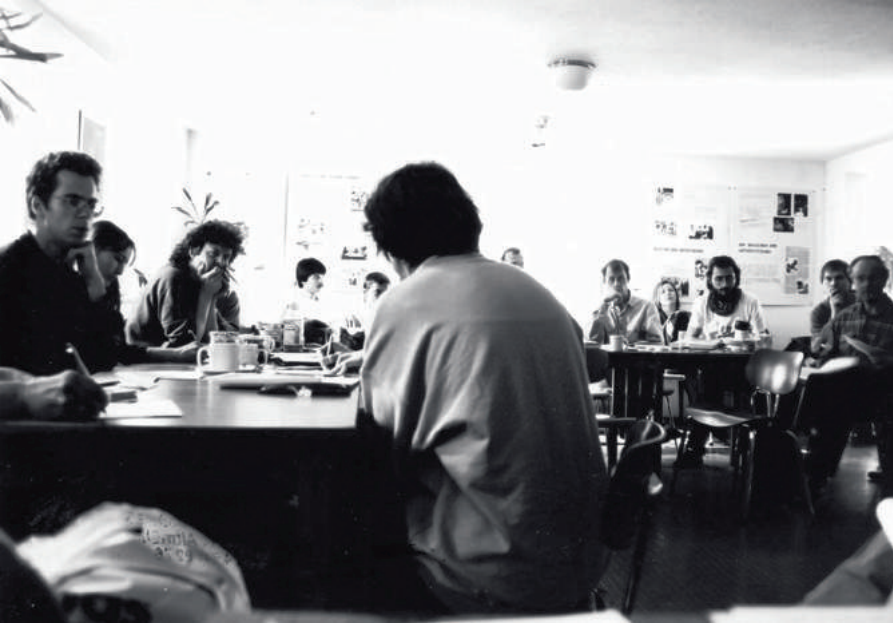
Gründungsversammlung Kooperation Brasilien 1990 in Freiburg