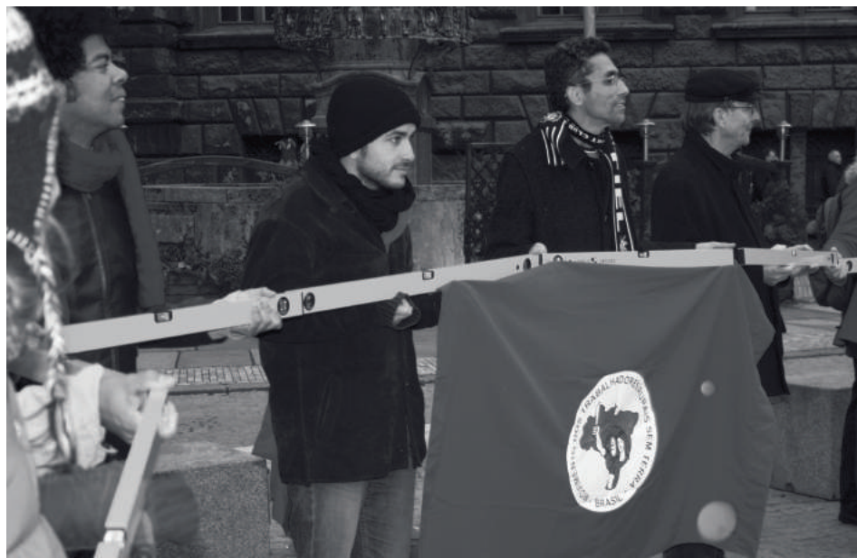
Protestaktion beim Runden Tisch Brasilien 2009 in Leipzig

Der Protest gegen die VW-Farm in Amazonien - beginnend im Mai 1983 - hatte darüber hinaus noch eine viel internationale Dimension und schlug medial wie eine Bombe ein. Die katholische Landpastorale Comissão Pastoral da Terra (CPT) hatte im Mai 1983 gemeinsam mit brasilianischen Gewerkschafter*innen in Brasília zu einer Pressekonferenz geladen. Gast war ein von der VW-Fazenda Cristalino in Amazonien geflohener Arbeiter, der über die dortigen sklavenarbeitsähnlichen Verhältnisse berichtete. Daraufhin schlossen sich der Kampagne gegen die Geschäftspraxis des Volkswagenkonzerns in Brasilien, Gewerkschafts-, Solidaritäts- und Menschenrechtsgruppen aus Deutschland an. VW musste gegen Ende der erfolgreichen Kampagne seine Fazenda dichtmachen und ver-