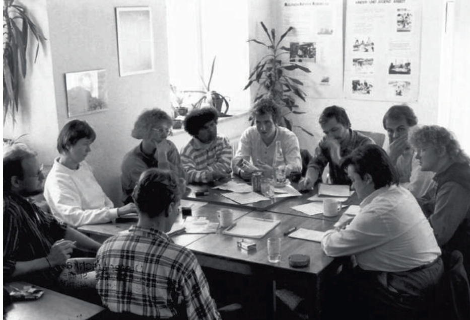
Gründungsversammlung der Kooperation Brasilien 1990 in Freiburg

Nein, es waren nicht nur deutsch-brasilianische Themen. Die