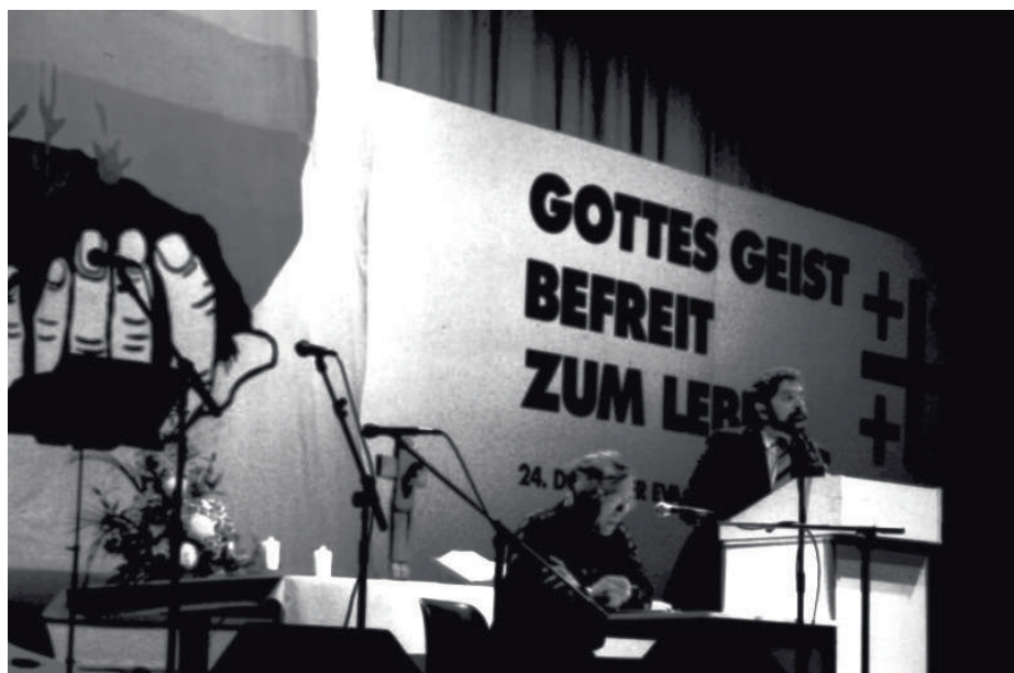
Lula bei dem Kirchentag 1991