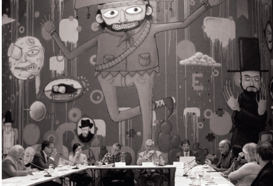
SP 10.05.2016 - Der damalige Kulturminister, Juca Ferreira, im Vorsitz einer außerordentlichen Ratssitzung

Die kulturell und rassisch hybride Gesellschaft, von der Freyre und später Buarque de Holanda mit dem „ homem cordial “