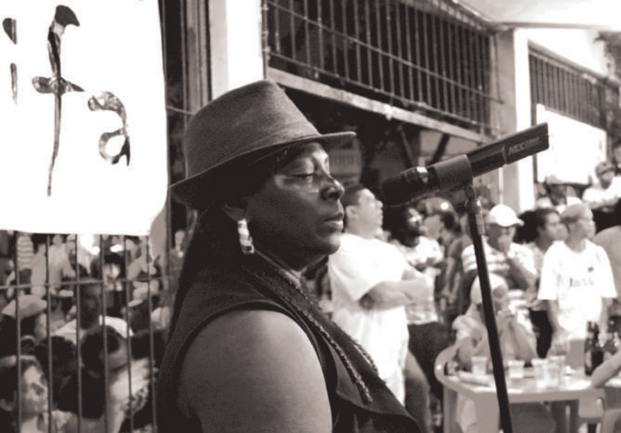
Preta Rose beim Sarau da Cooperifa

Berichterstattung zu einem Tatort und die Bewohner*innen zu Täter*innen.