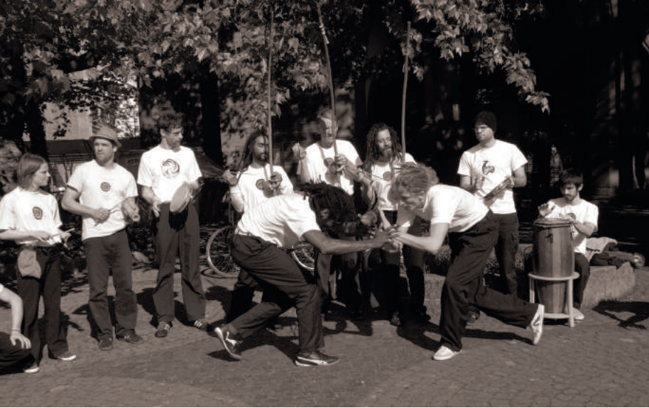
Gingando na roda de capoeira