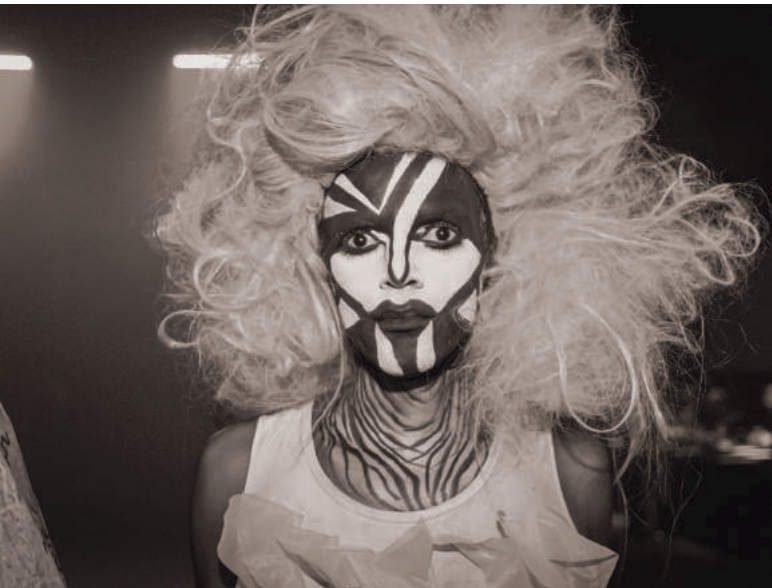
Party in einer leerstehenden Fabrik in São Paulo

ne der 1980er Jahre ist ebenso sichtbar wie der schwarz-schlichte Stil Berliner Partygänger*innen. Die Verbindungen in die deutsche Hauptstadt, die als weltweites Mekka elektronischer Musik gilt, sind ausgeprägt. Regelmäßig spielen brasilianische DJs in Berlin. Immer wieder finden Berliner Partys in São Paulo statt: Das sex-positive Pornconcept-Kollektiv und die queere CockTail d'Amore veranstalteten unlängst Partys in der brasilianischen Millionenstadt. „Berlin ist eine starke Referenz“, erklärt Carol, „aber wir versuchen nicht einfach nur den Stil von dort zu kopieren“. Paulo erklärt: „Die Inspiration für unsere Partys ist die Stadt São Paulo und die Erfahrungen hier“. Auch musikalisch geht die Szene ihren eigenen Weg. Der São Paulo-Stil ist hybrider – elektronische Beats treffen auf brasilianische Rhythmen. Oft begleitet Livegesang die Sets der DJs.