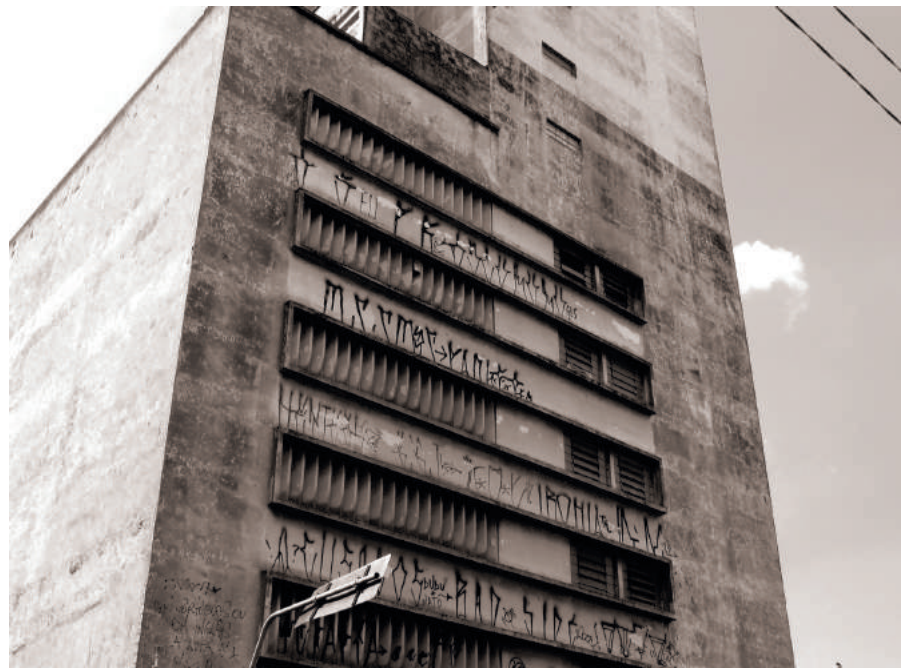
Pixação in São Paulo

Damit eine Gang Ansehen innerhalb der Pixadoresszene erhält, muss ihre Pixação erstens vielerorts zu lesen sein und zweitens an schwer zu erreichenden Punkten in der Stadt auftauchen. Die Pixadores klettern bisweilen spinnen ähnlich in schwindelerregende Höhen, um ihre Signatur an die Hochhäuserfassaden anzubringen. Die meisten Bewohner*innen São Paulos halten die Pixações für visuelle Verschmutzung, Vandalismus oder pure, sinnlose Zerstörungswut. Pixadores werden für Vandalen, Penner, Junkies, Psychos und kranke Menschen gehalten. Doch in jüngster Zeit haben eine Reihe universitärer Abschlussarbeiten und Dissertationen sowie die rege mediale Aufmerksamkeit etwas mehr Verständnis für die hochkomplexe Subkultur des Pixos erzielt. Die Pixadores verstehen ihre Handlung als den „Sport der Marginalisierten“ bzw. „die Kunst als Verbrechen und das Verbrechen als Kunst“. Insoweit lassen sich die Zeichen als eine visuelle Poesie und die dahinter steckenden Motivationen und Geschichten als Text und Diskurs interpretieren. Die Pixação als Praxis erzeugt eine Realität, die aus der Gesamtheit der Namenszüge in der Stadt besteht. Neben dem Ausdruck der Empörung über die gesellschaftlich-politischen Zustände verbirgt jeder Pixo ein Narrativ, das damit anfängt, dass die Pixadores ihre eigene, exklusive Typographie entwickeln. Sie verlassen ihre Häuser in den weiten Peripherien, beschaffen sich die Sprays oder Farben – häufig durch Diebstahl –, treffen sich an einem