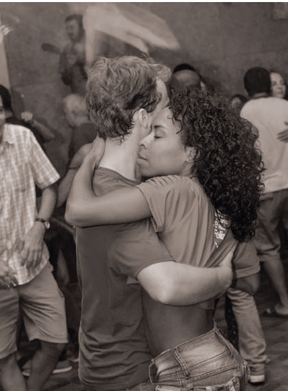
Quarta Democrática in Rio de Janeiro

den populären „Forró Eletrônico“ ab. Beim „Forró Universitário“ erweiterten die Studierenden den rudimentären Tanz der Forró-Feste aus dem Nordosten durch Elemente aus vielen populären Tänzen wie „Samba de Gafiera“ (Salonsamba), „Coco“ oder „Rockabilly“.