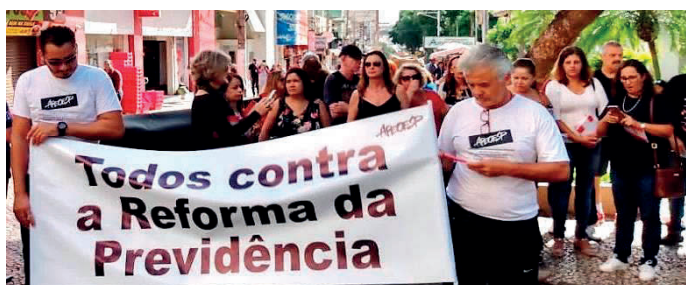
ALLE GEGEN DIE RENTENREFORM