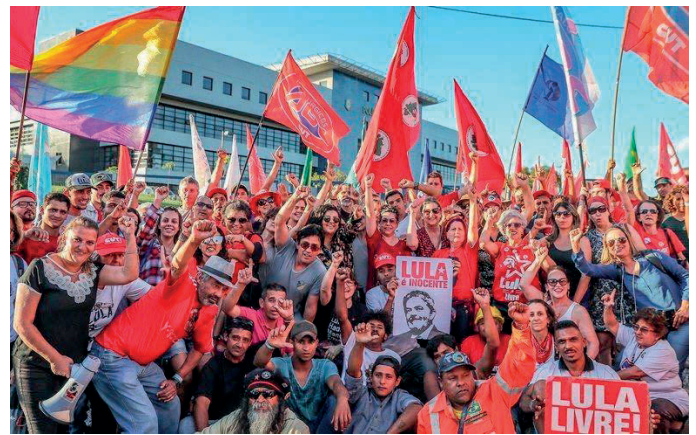
Protest vor dem Gefängnis in Curitiba

Samper, Pepe Mujica, Adolfo Perez Esquivel, Aleida Guevara, Leonardo Boff und Martin Schulz u.a. haben das Widerstandscamp schon besucht. Viele Menschen sind dort seit der Festnahme des Präsidenten. Einige blie- ben ein paar Tage, andere kommen und ge- hen. Das Widerstandscamp kämpft gegen die Ungerechtigkeit der Justiz und hat das Ziel, Lula zu unterstützen und für seine Freiheit zu kämpfen. Wie die Anhänger/Innen Lulas sa- gen: " Wir werden Curitiba nur verlassen, wenn Lula frei ist!".