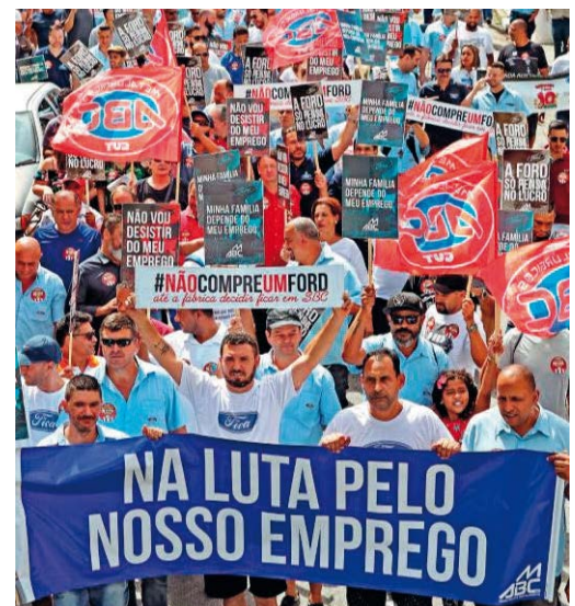
Im Kampf für unseren Arbeitsplatz