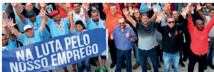
IM KAMPF FÜR UNSEREN ARBEITSPLATZ

Jetzt also hat Bolsonaro das Thema wieder aufgegriffen und am 20. Februar die Gesetzesvorlage dazu bekanntgegeben. Da das aktuelle Rentensystem die Haushaltskasse zu 13 % belastet, muss auf jeden Fall eine Änderung durchgeführt werden, wenn das Land überleben soll. Diese hohen Kosten entstehen wohl hauptsächlich dadurch, dass bestimmte höherstehende Bevölkerungsgruppen wie Militärs, Richter, Staatsbeamte etc. ganz außergewöhnlich hohe Renten beziehen: z. B. ab 55 Jahren dasselbe Gehalt weiter erhalten wie bislang und das im Todesfall auf die Ehefrau und auch die unverheirateten Töchter übergeht. Das soll so bleiben! Die Misere wird dadurch erhöht, dass viele Unternehmen ihre Beiträge nicht bezahlen. Das Hauptmittel der Verbesserung soll die sogenannte „ Kapitalisierung “ der Rente sein. Das bedeutet: die Rentenkasse wird in das Finanzsystem überführt nach dem Vorbild von Chile, wo es schon ganz deutlich zur Verarmung der unteren Bevölkerungsschichten geführt hat. „Die einzigen Gewinner sind die Banken“, sagt eine Soziologin von DIEESE, dem wissenschaftlichen Institut der Gewerkschaften.